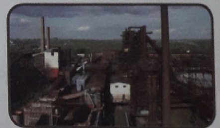
Vysoké pece - Vítkovice

4. Víš, kde se nachází třetí největší letiště v Česku, které ročně odbaví 300 tisíc cestujících? Vylušti křížovku: