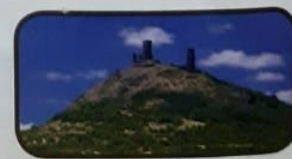
zřícenina hradu Hazmburk v Českém středohoří

4. Ústecký kraj má řadu chemických závodů různého zaměření, spoj podniky s jejich produkcí a místem výroby: